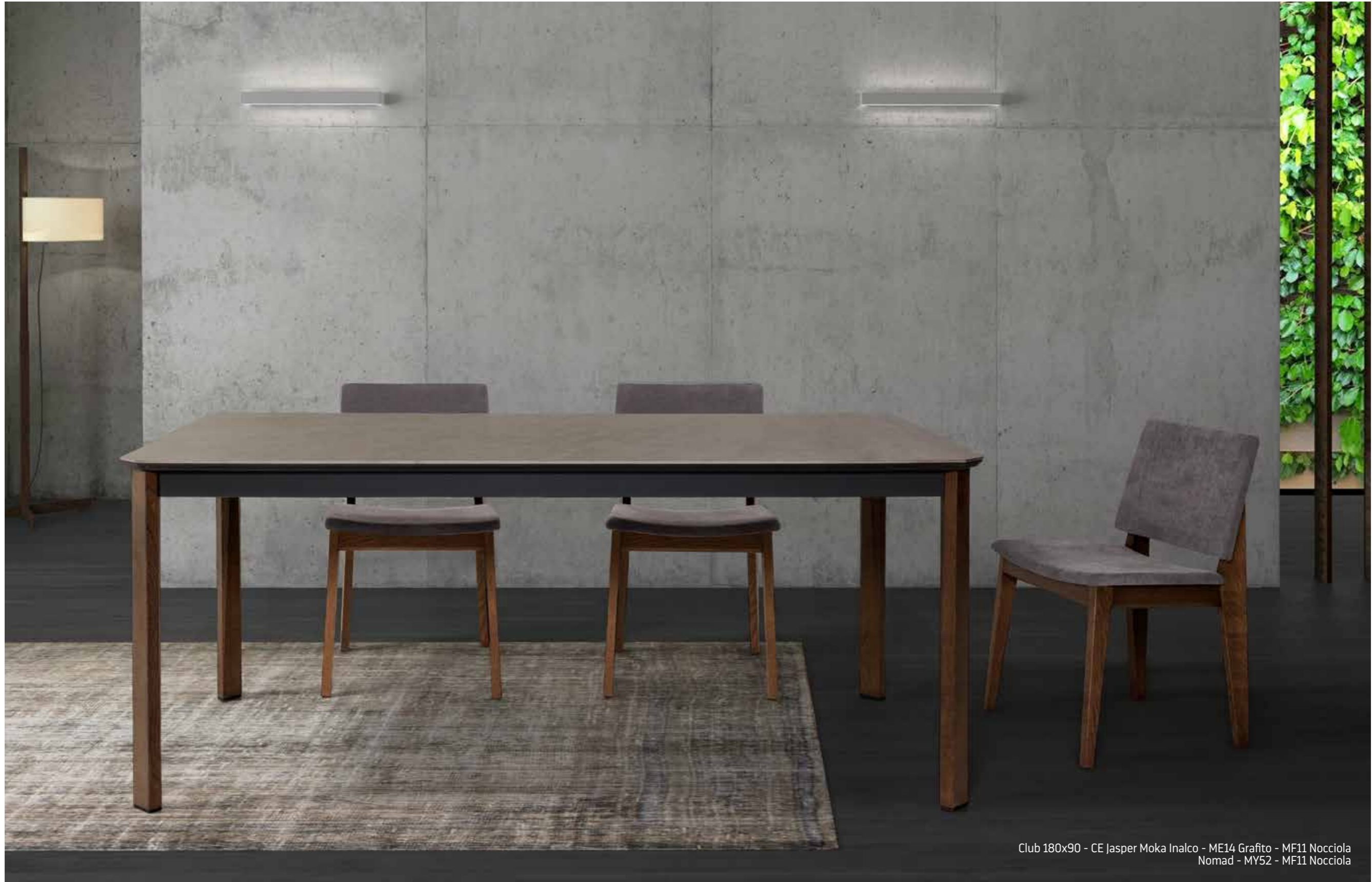
Club 180x90 - CE Jasper Moka Inalco - ME14 Grafito - MF11 Nocciola Nomad - MY52 - MF11 Nocciola