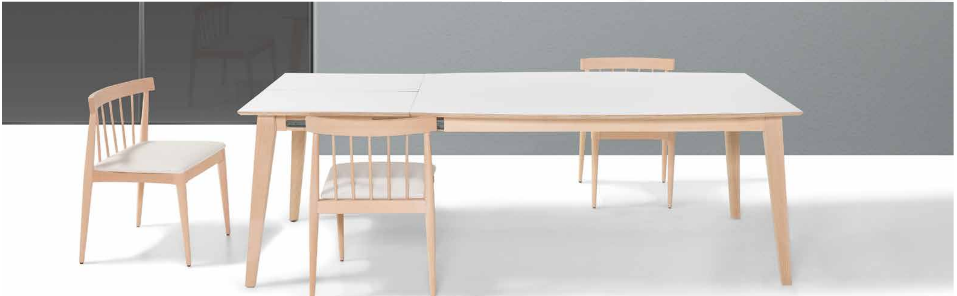
Mare 160x90 - Fenix Alaska - MH50 Nordik Greta - FT200 - MH50 Nordik