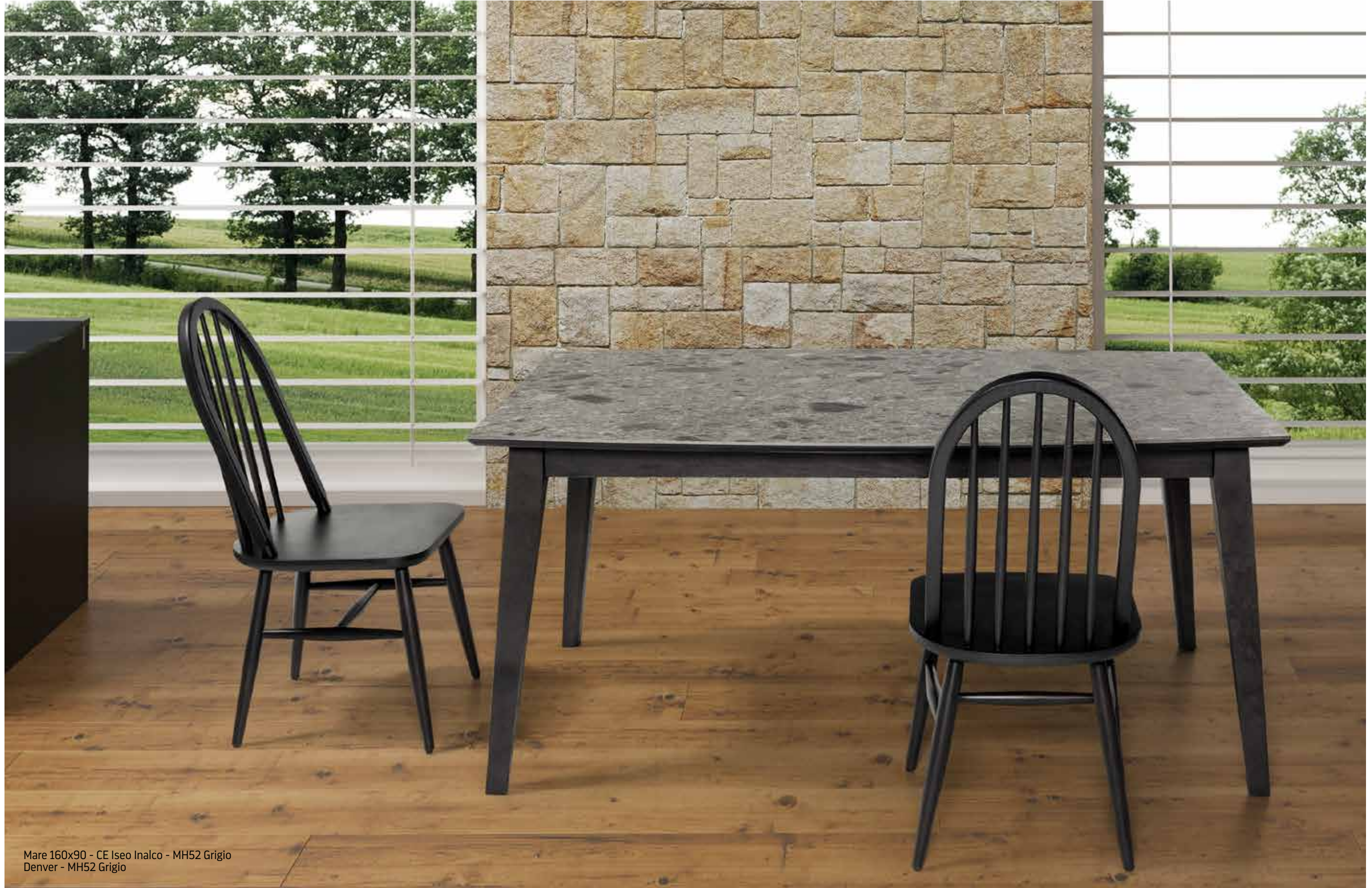
Mare 160x90 - CE Iseo Inalco - MH52 Grigio Denver - MH52 Grigio