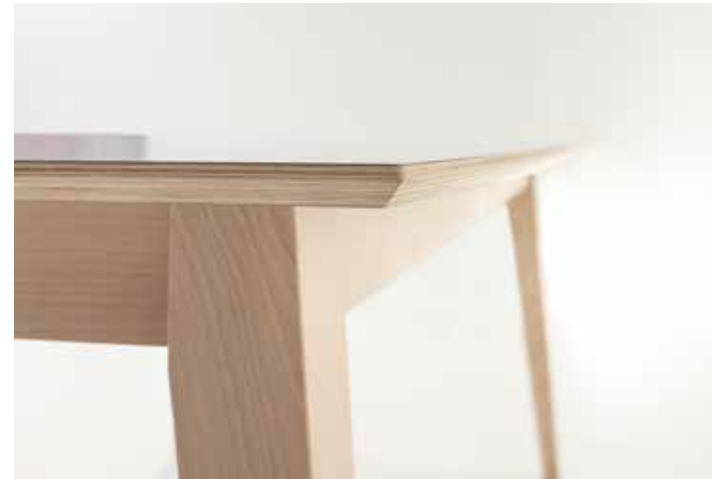
Laminado Fenix aplacado con canto de madera. Fenix laminate with wooden edge