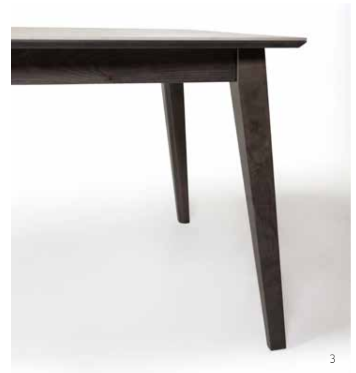
DETALLES / DETAILS 1. Sistema de extensión / Extension system. 2. Cerámico sobre base de Fibracolor Bisel / Ceramic on full black mdf. 3. Detalle constructivo de las patas / Construction detail of the legs.