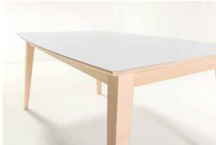
Detalle de la suave curva del tablero. Detail of the elegant curve of the top.