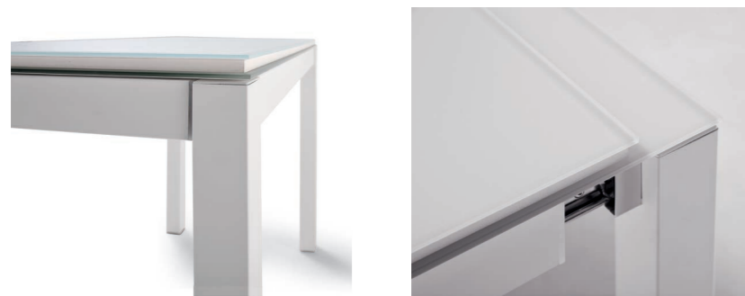
Máxima apertura de bastidor Maximum rack opening Ouverture maximale du châssis Maximale Öffnung des Untergestells