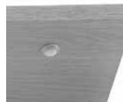
Detalle de niveladores para las extensiones. Detail picture of levelers for extensions.