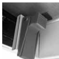
Detalle del freno del sistema de extensión. Detail of the extension system brake.