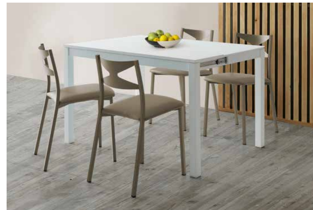
Detalle mesa Chika de 120x50cm abierta a 120x80cm.. Detail of Chika table 120x50cm open to 120x80cm