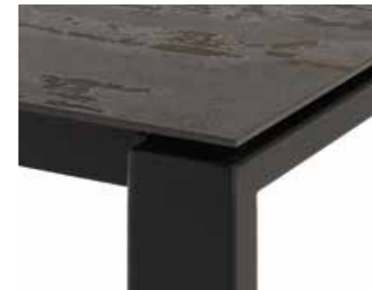
Tablero flotante. Floating top.