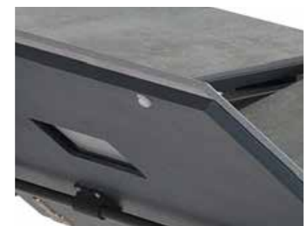
Detalle de niveladores para las extensiones. Detail picture of levelers for extensions.