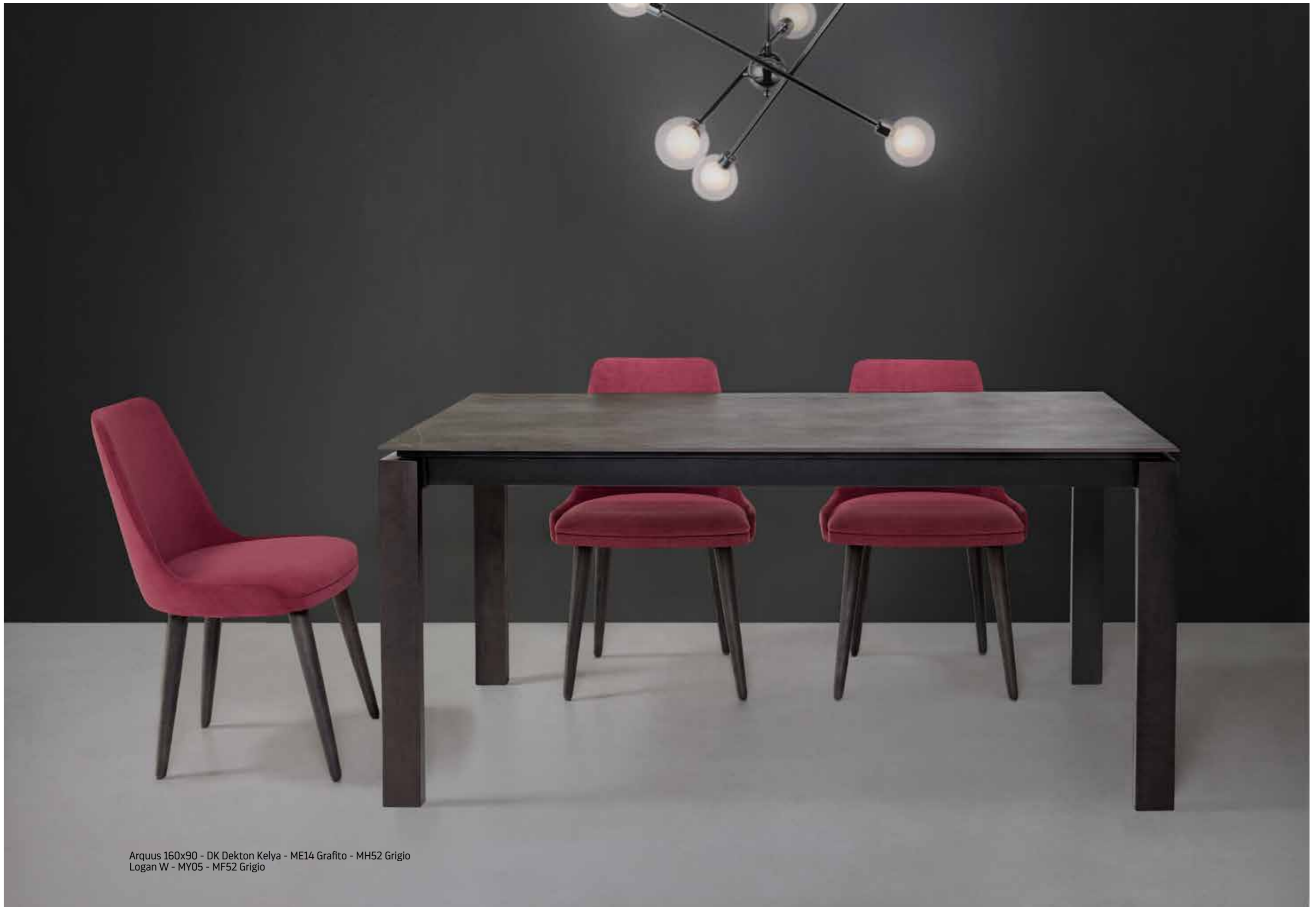
Arquus 160x90 - DK Dekton Kelya - ME14 Grafito - MH52 Grigio Logan W - MY05 - MF52 Grigio