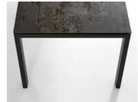
Patas en forma de pórtico. U-shaped legs.