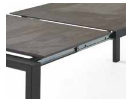
Guías telescópicas de alta resistencia. High resistance telescopic guides .