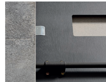
Extensión de con base de madera barnizada, con asidero mecanizado y apoyo de seguridad. Extension with varnished wood base, with mechanized handle and safety support. Extension avec base en bois verni, avec poignée mécanisée et support de sécurité. Verlängerung mit lackiertem Holzfuß, mit mechanisiertem Griff und Sicherheitsstütze.