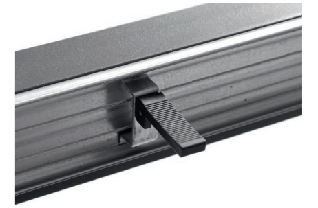
Bloqueo del sistema de extensión Blocking the extension system Bloquer le système d'extension Das Erweiterungssystem blockieren