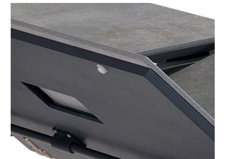
Detalle de niveladores para las extensiones Detail picture of levelers for extensions Détail photo de nivellement pour les extensions Detail Foto von Nivelierung für Erweiterungen