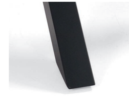
Patas con reguladores de altura Legs with height adjusters Pieds avec des régleurs de hauteur Beine mit Höhenverstellern