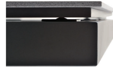
12 apoyos con rodamiento para una suave apertura 12 supports with bearing for a smooth opening 12 roulements avec palier pour une ouverture en douceur 12 Lager mit Lager für eine reibungslose Öffnung