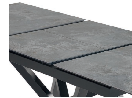
Apertura Central Sincronizada Synchronized Central Opening Ouverture Centrale Synchronisée Synchronisierte Zentrale Öffnung