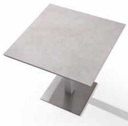
Base de acero pintada a juego con la columna. Painted steel base matched with the column.