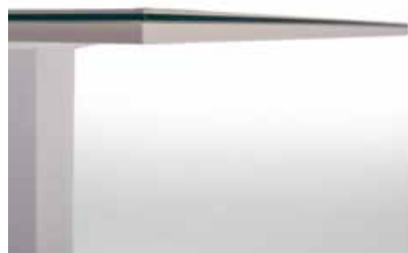
Canto del soporte a juego en columna. Edge of the base matching with column.