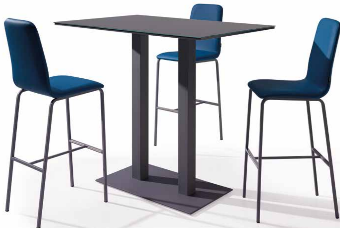
Mesa Ania 110x70 h110 CA14 Grafito - ME14 Grafito Julia Bar XL MY510 - ME14 Grafito