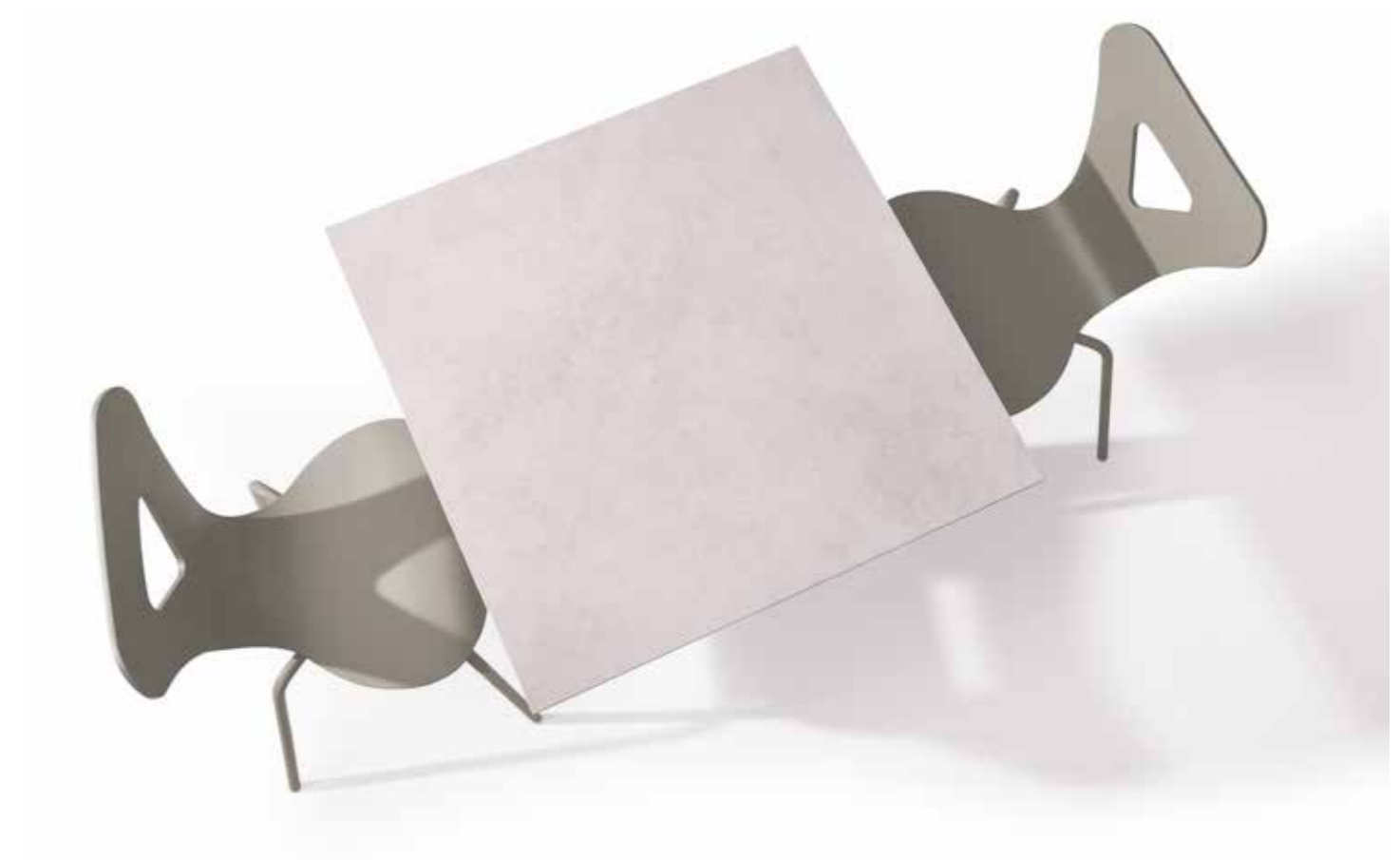
Las tapas del modelo Ania se fabrican con un soporte en madera con el canto a juego de la pata, seguridad y belleza. The Ania model worktops are made with a wooden support with the matching edge of the leg, safety and beauty.