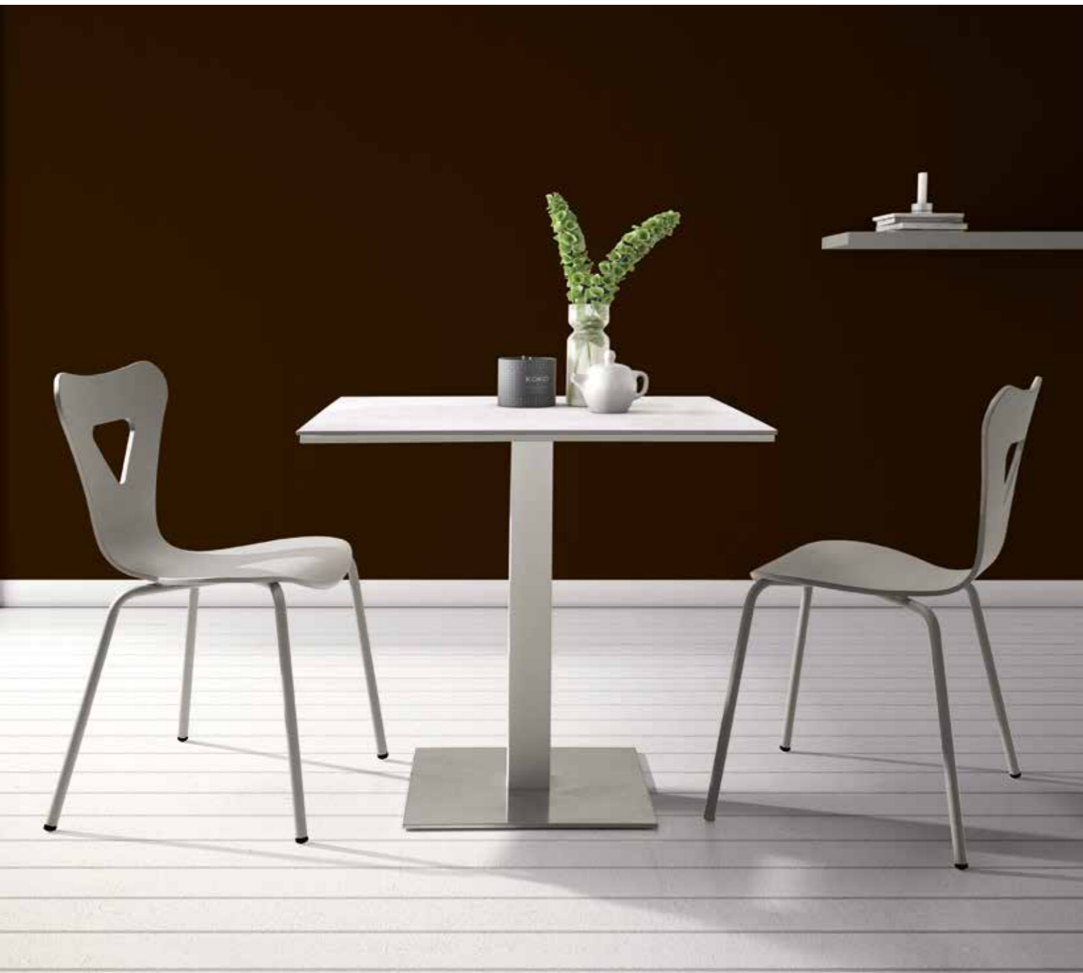
Ania 80x80 Dekton Nilium - ME102 Perla Vicky LT102 Perla - ME102 Perla