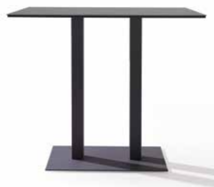
Doble pilar en mesas rectangulares a partir de 110x70. Double column on rectangular tables from 110x70 size.