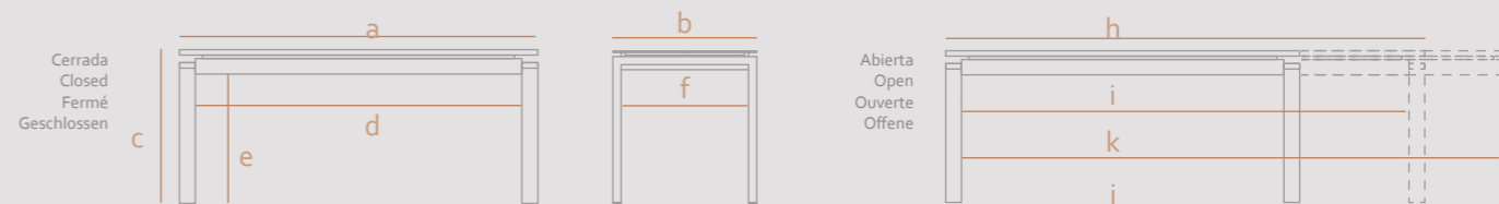
2 Extensiones 50cm / 2 Extensions 50cm / 2 Allonges 50cm / 2 Auszieplatte 50cm