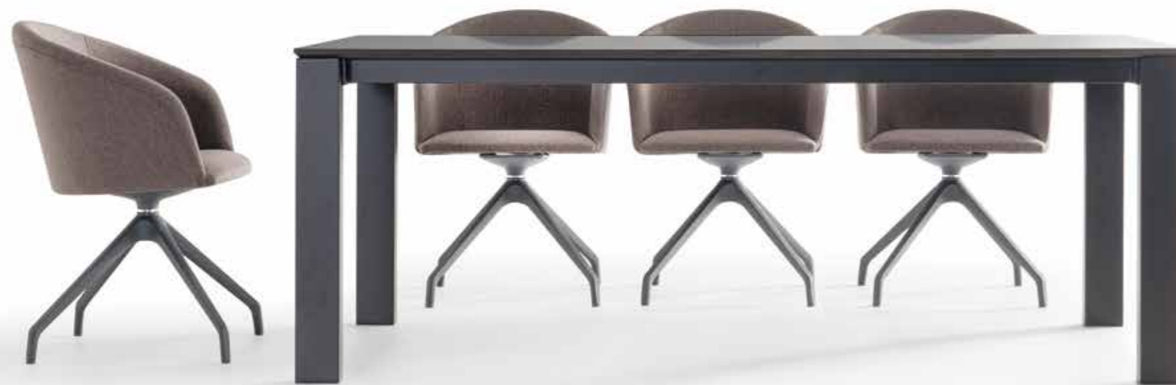
Nora Fija 200x100 Top Fenix 0720 Nero - Base Met03 Negro