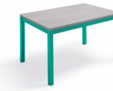
Patas / Legs Pieds / Beine