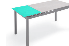
Extensión / Extension Rallonge / Verlängerung