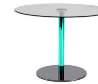
Patas / Legs Pieds / Beine

Cristal Transparente / Transparent Glass Verre Transparent / Transparentem Glas