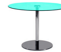
Encimera / Top Plateau /Arbeitsplatte

Cristal Transparente / Transparent Glass Verre Transparent / Transparentem Glas