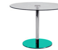
Base / Base Base / Tischfuß